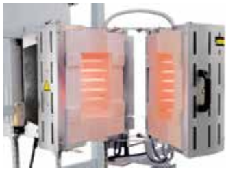
RS 100/250/11S en acabado desplegable para montaje en un dispositivo de prueba.

Mediante un alto grado de flexibilidad e innovación Nabatherm ofrece la solución óptima para aplicaciones específicas del cliente.