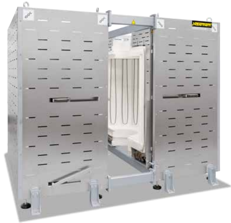
RS 460/1000/16S para integración en una planta de producción