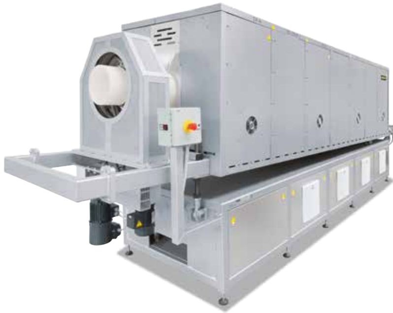
Horno tubular rotatorio RSR 250/3500/15S